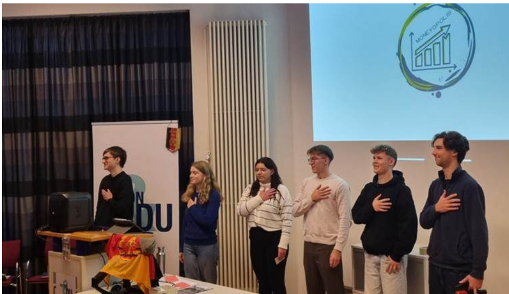
Nation&Du Workshop an der IBS Oldenburg, November 2024

O-Töne aus den verschiedenen Seminaren und Projekten vermitteln einen lebhaften Eindruck und bezeugen die hohe Qualität unserer Bildungsprodukte: