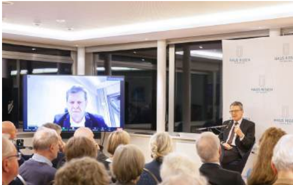
Abendveranstaltung am 20. Februar 2024