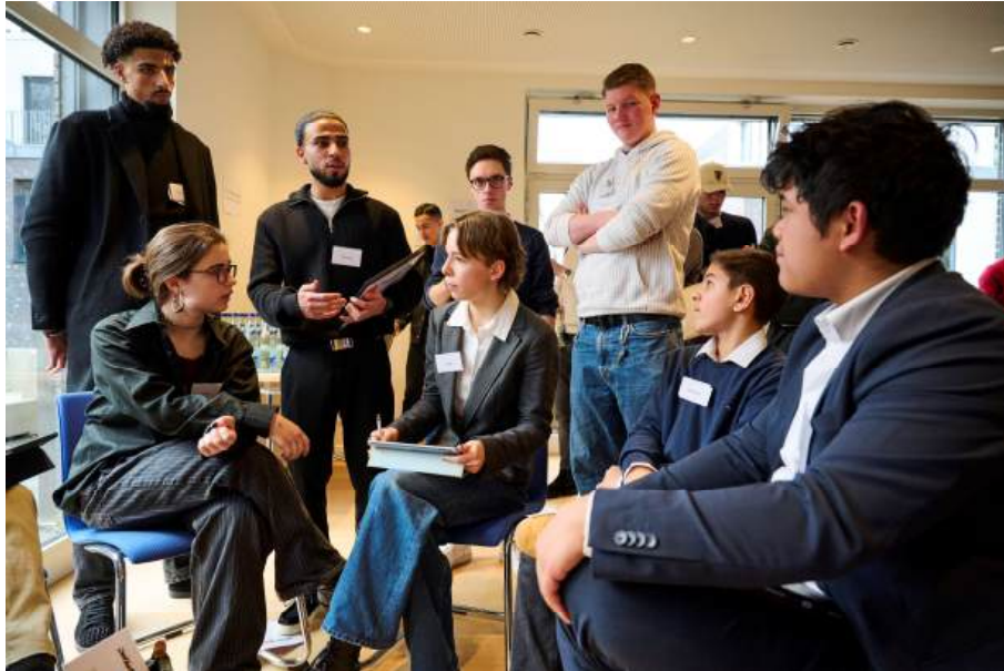
Verhandlungen bei der SVeN Simulation, Dezember 2024