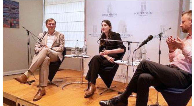
Abendveranstaltung am 16. Mai 2024