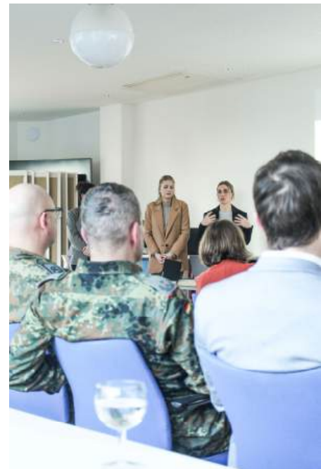
Seminar für die Bundeswehr, März 2024

Die Seminare wurden von den Einheiten der Bundeswehr sehr gut angenommen, wie mehrere O-Töne aus verschiedenen Seminaren verdeutlichen: