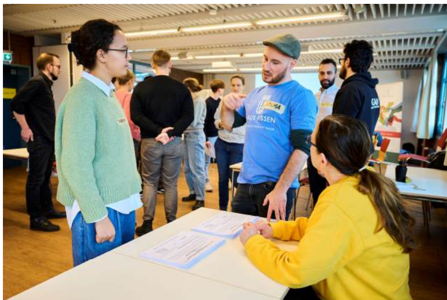
ERSTWAHLPROFIS Train-the-Trainer-Seminar im Bürgerhaus Wilhelmsburg, November 2024