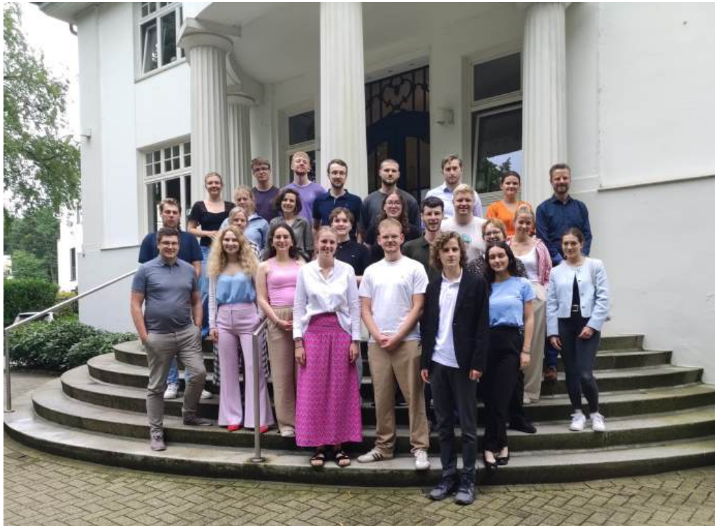
Sicherheitspolitische Summer School, August 2024

auch in 2025 diese sicherheitspolitische Summer School erneut durchgeführt werden. Finanziert wurden beide Summer Schools in 2024 von der Bundeszentrale für politische Bildung (BpB).