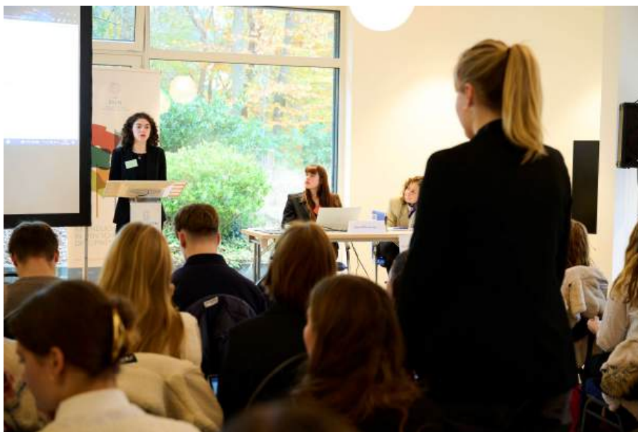
SVeN Simulation in HAUS RISSEN, November 2024

Ein zentraler Schwerpunkt der Weiterentwicklung des Projekts für den nächsten Durchlauf wird die Sprachförderung sein. SVeN arbeitet mit formellen Regeln und juristisch formulierten Konventionsentwürfen, wodurch die Jugendlichen mit einer anspruchsvollen Sprache konfrontiert werden. Diese Sprache ist für viele Teilnehmerinnen und Teilnehmer eine Herausforderung. Um ihnen den Zugang zu erleichtern, werden wir ergänzende Erklärungen in einfacher Sprache bereitstellen. Dabei bleibt das Ziel bestehen, dass alle Delegierten die juristische Fachsprache verstehen und anwenden können.