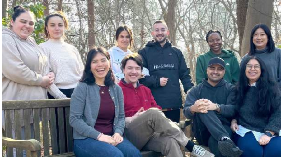
Pflegefachschule am Ev. Krankenhaus Alsterdorf am 16. Mai 2024

Pflegefachschule am Ev. Krankenhaus Alsterdorf, August 2024