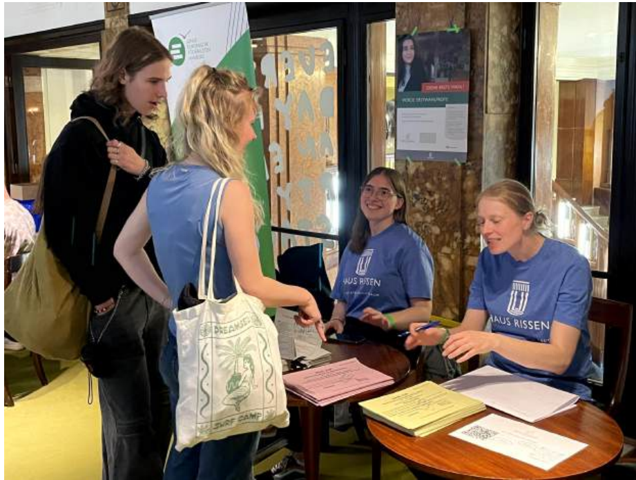
ERSTWAHLPROFIS-Testwahllokal im Thalia-Theater im Rahmen der GoVote-Kampagne, Juli 2024

konnte unsere Arbeit an der Bundestagswahl trotz der widrigen Umstände erheblich von der bereits geleisteten Vorbereitung der Bürgerschaftswahl profitieren.