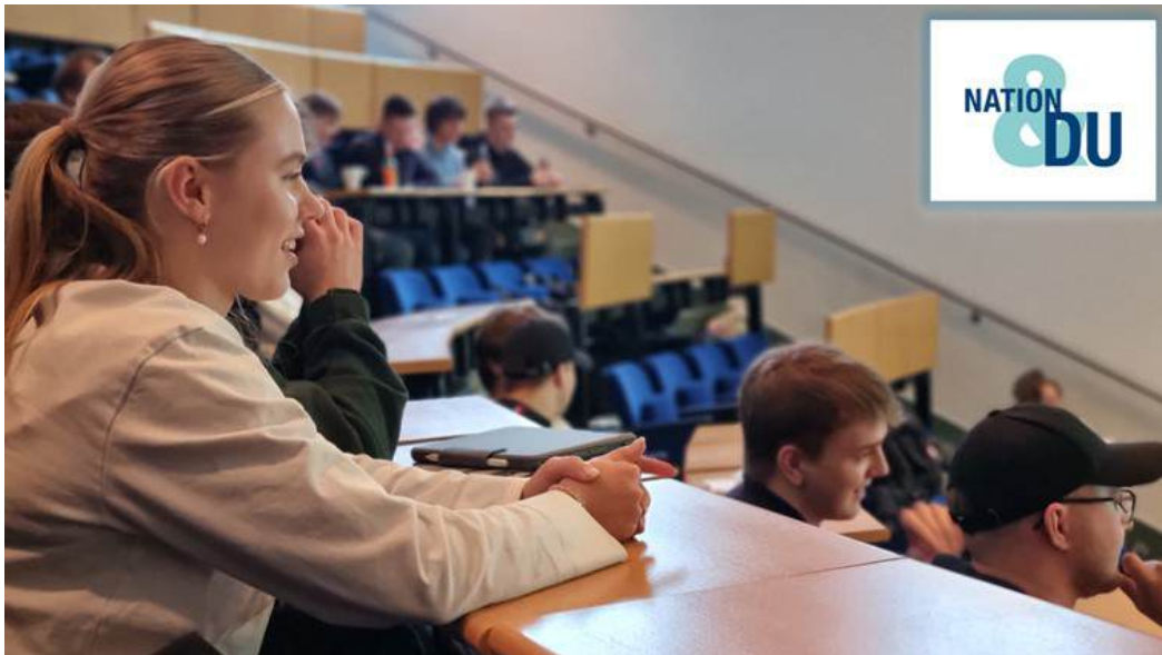
Nation&Du Workshop an der IBS Oldenburg, November 2024

Parallel zur Ausrichtung auf diese neuen Zielgruppen konnte unter Vermittlung der Deutschen Nationalstiftung eine Förderung durch die Stiftung Würth für drei Jahre akquiriert werden. Von diesen Mitteln sollen ab 2025 jährlich ca. sechs Seminare mit Schulklassen in unterschiedlichen Bundesländern durchgeführt werden, um das Projekt bundesweit bekannter zu machen.